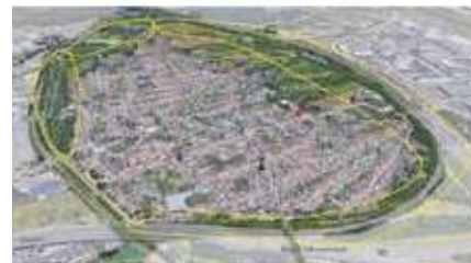
Groene Ring rond Machelen

De groene bermen van de verkeersstructuren bieden een kans om de ring rond Machelen te creëren als een aaneensluitend lint van buurtparken en boszones.