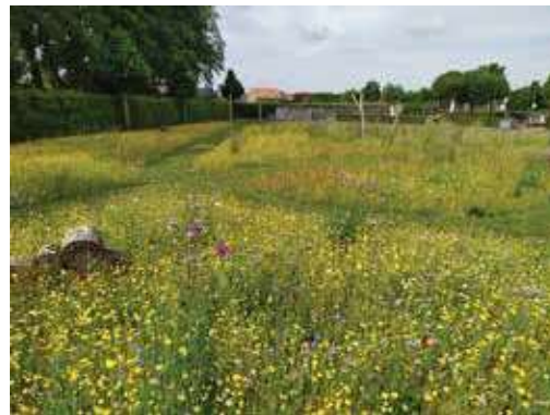
Begraafplaats van Diegem: een bloemenweide in bloei.

Machelen behaalde als bloemrijke gemeente in de categorie Gemeente in bloei twee sterren, als bijenvriendelijke gemeente behaalden we ook twee sterren en we werden zesde laureaat omgevingsgroen voor de binnentuin van 't Kanthof. Dat wij – ondanks het feit dat wij de meest verharde gemeente van Vlaanderen zijn – in de prijzen vallen, is heel opmerkelijk. Dat hebben we te danken aan alle ideeën en ontwerpen die onze gemeentelijke diensten samen uitwerken. Als bevoegde schepen is het fijn om met hen samen te werken.